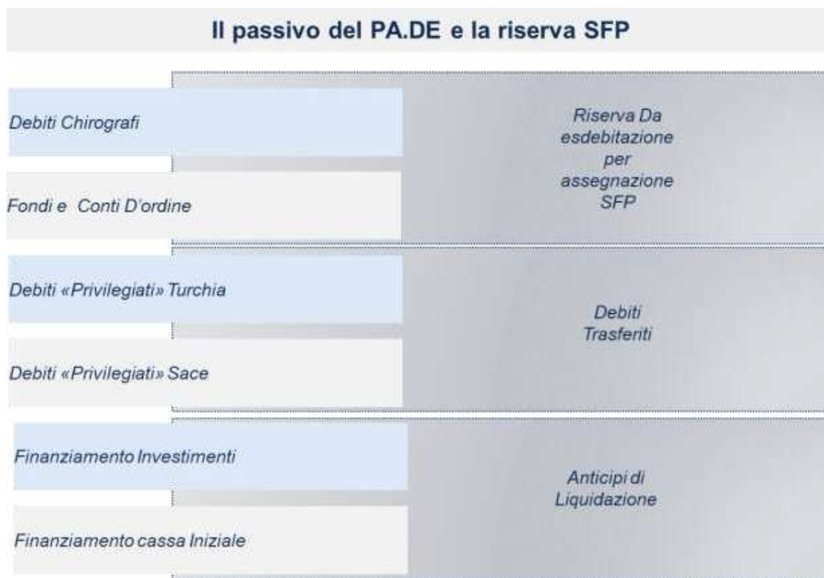
FIGURA 2: RAPPRESENTAZIONE SINTETICA DEL PASSIVO PATRIMONIO DESTINATO E DELLA RISERVA SFP

Costituiscono il Patrimonio Destinato anche tutti i beni, i diritti e i rapporti giuridici (attivi e passivi) che verranno ad esistenza e sorgeranno a qualsiasi titolo nel corso e per effetto della gestione dello stesso Patrimonio Destinato. Di contro, sono espressamente esclusi dal Patrimonio Destinato tutti i rapporti giuridici, i diritti, i crediti, gli oneri e gli obblighi anche di garanzia, controgaranzia e manleva di Astaris relativi alla sola esecuzione dei lavori affidati dalla Società Etlik, dalla Società NPU, dalla Società Salud, dalla Società GOI e dalla Società Terzo Ponte, direttamente ad Astaris ovvero a joint venture , consorzi o società in qualunque forma giuridica costituiti con la partecipazione di Astaris.