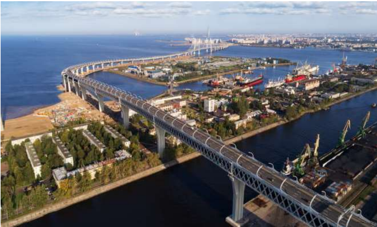
FIGURA 2: AUTOSTRADA GEBZE OTOYOL IZMIR (GOI) - TURCHIA