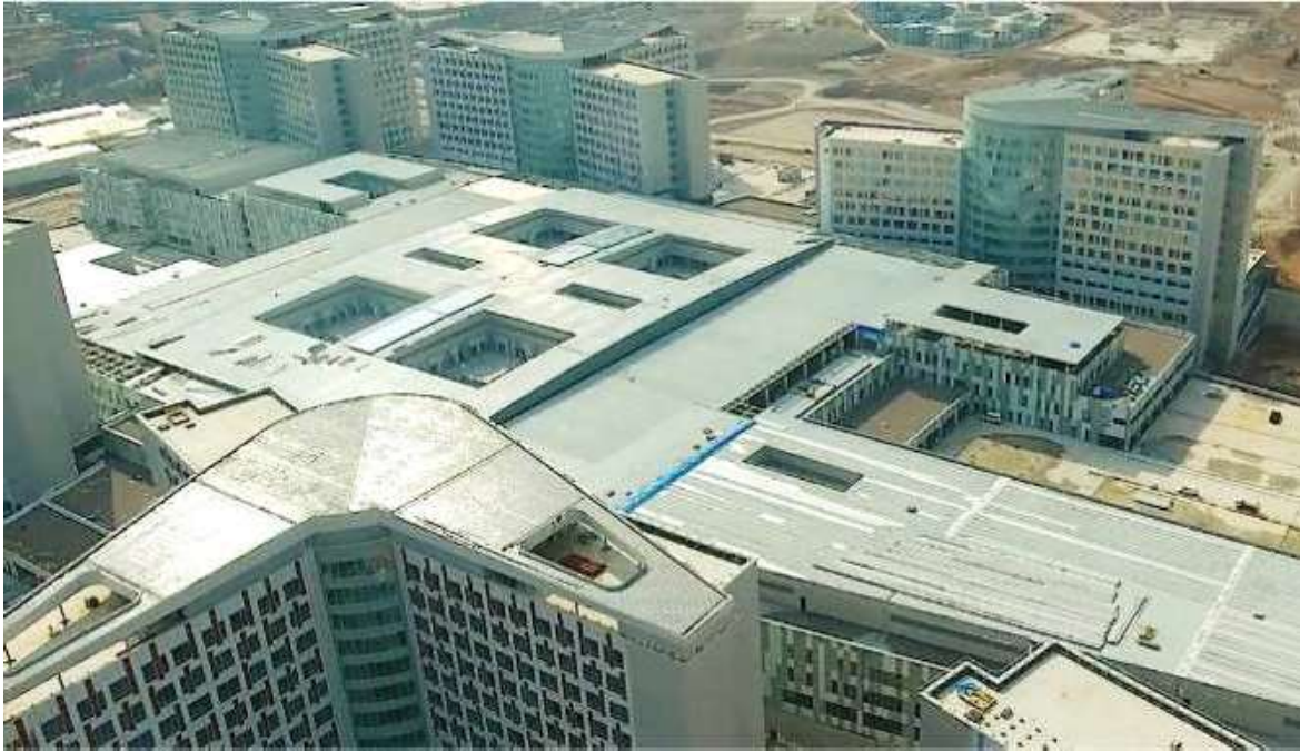
FIGURA 1: ETLIK HOSPITAL - TURCHIA