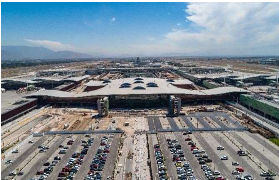
FIGURA 3: SANTIAGO AIRPORT – CHILE