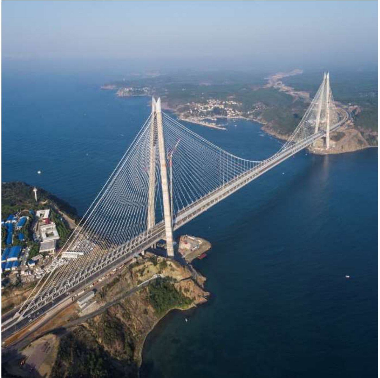
FIGURA - TERZO PONTE SUL BOSFORO - TURCHIA